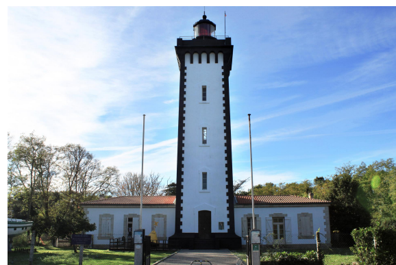
Le phare de Grave

Deux autres phares du Nord Médoc, tout aussi remarquables, proposent des visites.