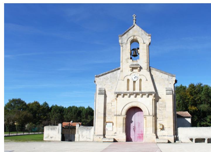
La chapelle Saint-Jean-Baptiste à Grayan-et-l'Hôpital

Les traces des différents pèlerinages sont aussi palpables sur toute la destination Médoc Atlantique à l'exemple de la statue de Saint-Jacques en costume datant du XVII e siècle visible dans l'église Saint-Martin à Carcans-Maubuisson.