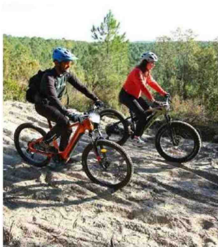
Quelques rares passages en crête permettent de visualiser l'immensité de la forêt médocaine.