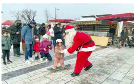
Un père Noël prof de skate à Lacanau .

amis se transforment en humains pour sauver le théâtre du vieux monsieur qui les manipule, et par la même occasion, vivre des grandes aventures. Un goûter est prévu à l'issue du spectacle.