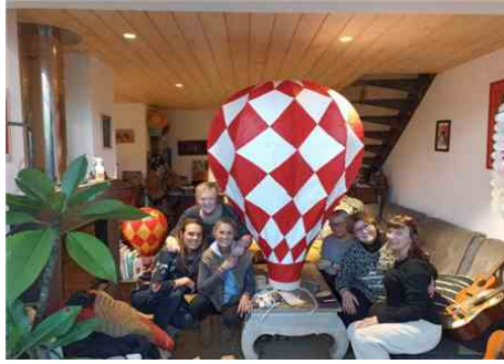
L'association Ramdam commence à travailler dès le mois de septembre pour préparer son Lacanoël. L'équipe de l'association Ramdam au boulot. P. C. P. C.