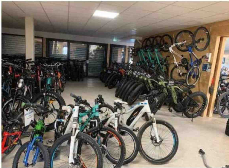
Chez les loueurs de vélos de Lacanau, on a le choix entre musculaire, fat bike ou e-bike classique, comme ici chez Evolution 2. Et 10 minutes plus tard, tu roules sur la plage !