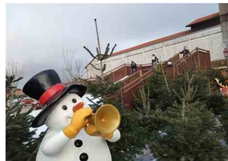
Des pistes de luge sont installées au cœur de la forêt de Noël, sur la place des manèges. M. C.

(1) Renseignements et inscriptions au 0680488264. Programme détaillé sur mairie-soulac.fr