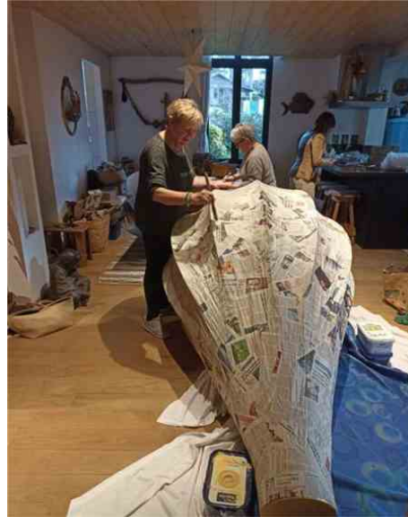
L'association Ramdam commence à travailler dès le mois de septembre pour préparer son Lacanoël. L'équipe de l'association Ramdam au boulot. P. C. P. C.