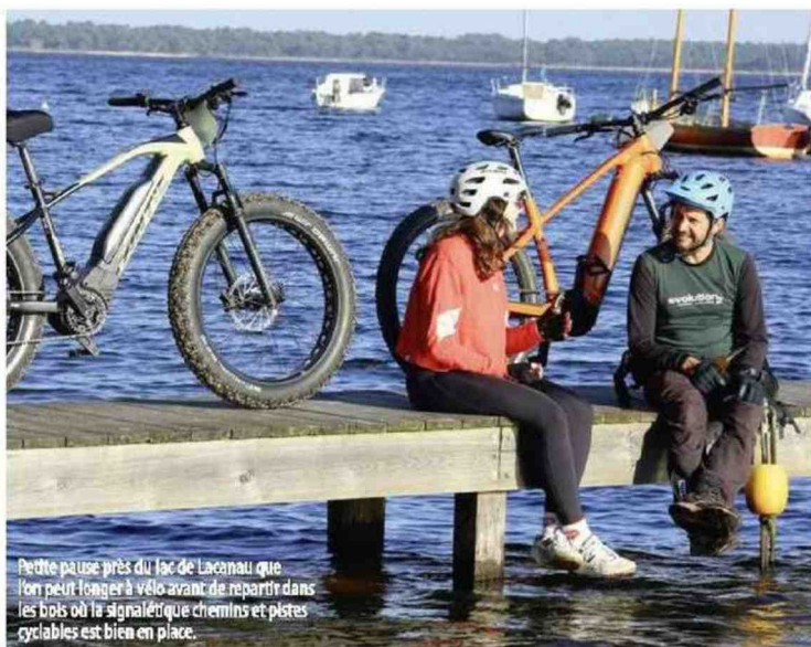
Petite pause près du lac de Lacanau que l'on peut longer à vélo avant de repartir dans les bois où la signalétique chemins et pistes cyclables est bien en place.

J e ne savais pas que le Médoc avait son parc naturel régional. Tout comme je ne me préoccupais guère de l'état des chemins dans ce coin de France proche de l'océan Atlantique. Ce triangle de terre est délimité par Bordeaux à l'est, le bassin d'Arcachon au sud et l'estuaire de la Gironde au nord. En tant que cycliste habitué aux dénivelés montagneux, le Médoc m'apparaissait comme une terre