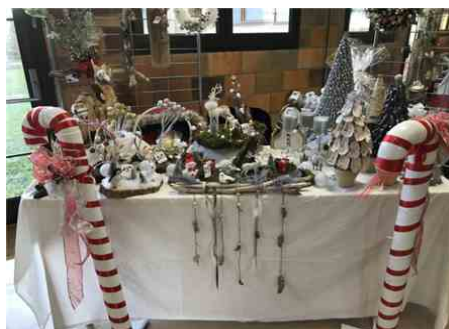
Le Père Noël sera sur le marché tout le week-end, de 16h30 à 18 heures.