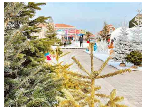
Une forêt de sapins de Noël à Soulac .

proposera une lecture de conte. Capucine cuisine reviendra le samedi 28 à 16h pour un atelier cuisine. Enfin, dimanche 29, à partir de 17h30, un apéro musical, accompagné de chants de la chorale de l'église, clôturera cette série d'animations. Les gourmands pourront aussi profiter de la buvette de l'Amicale de l'école primaire soulacaise qui proposera des gâteaux, des crêpes, du vin (ou du chocolat) chaud, les week-ends des 21-22 et 28-29 décembre, de 15h à 18h.