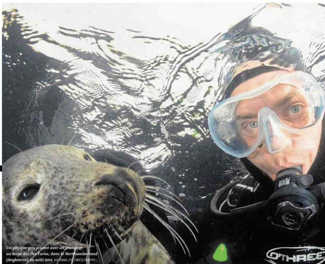
Un phoque gris jouant avec un plongeur au large des îles Farne, dans le Northumberland (Angleterre), en août 2011.

DES VIES OCÉANIQUES. QUAND DES ANIMAUX ET DES HUMAINS SE RENCONTRENT, de Fabien Clouette, Seuil, « La couleur des idées », 240 p., 22 €, numérique 16 €.