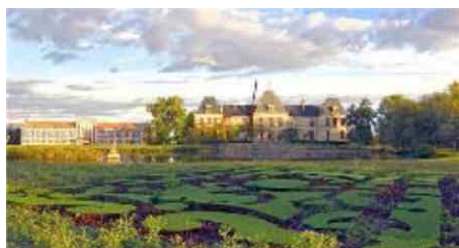
Des châteaux et des jardins à découvrir durant tout un week-end, les 5 et 6 avril prochains.

Le principe de cette manifestation organisée par les Vins du Médoc, Bordeaux Négoce et Médoc Vignoble tourisme est simple : il s'agit, le temps d'un week-end, de découvrir vignes, chais, cuiviers, châteaux et vins des viticulteurs du Médoc. Des animations autour du patrimoine ou à destination d'un jeune public, des concerts et des expositions accompagnent cette opération portes ouvertes. Si les visites sont gratuites, certaines activités proposées (et bien sûr la restauration) sont payantes.