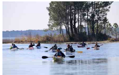
Les bonnes conditions climatiques ont motivé des touristes à venir découvrir le lac de Lacanau en mode kayak. J. L.

(1) L'OT communautaire Médoc Atlantique couvre 13 communes. Huit stations balnéaires sur le littoral, entre Lacanau et Le Verdon et cinq communes en pleine nature le long de l'estuaire.