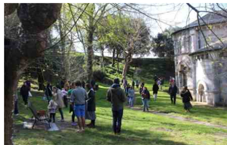
La chasse aux œuf de Pâques ravira les plus petits.

Renseignements auprès de Label Soulac ou sur Facebook, au 0975430729 ainsi qu'à l'office de tourisme.