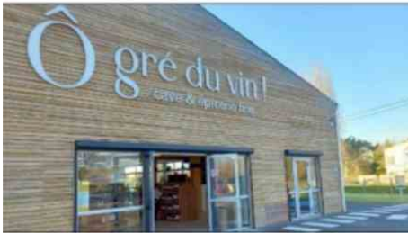
Situé sur la route départementale 1215, Ô Gré du Vin bénéficie d'un emplacement idéal.