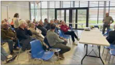
Plus de 45 personnes étaient présentes lors de l'assemblée générale de Sportfishing Port Bloc.

LE VERDON-SUR-MER. La jeune association Sportfishing Port Bloc a trouvé sa place à la Pointe du Médoc, et dans l'univers de la pêche de loisir régionale.